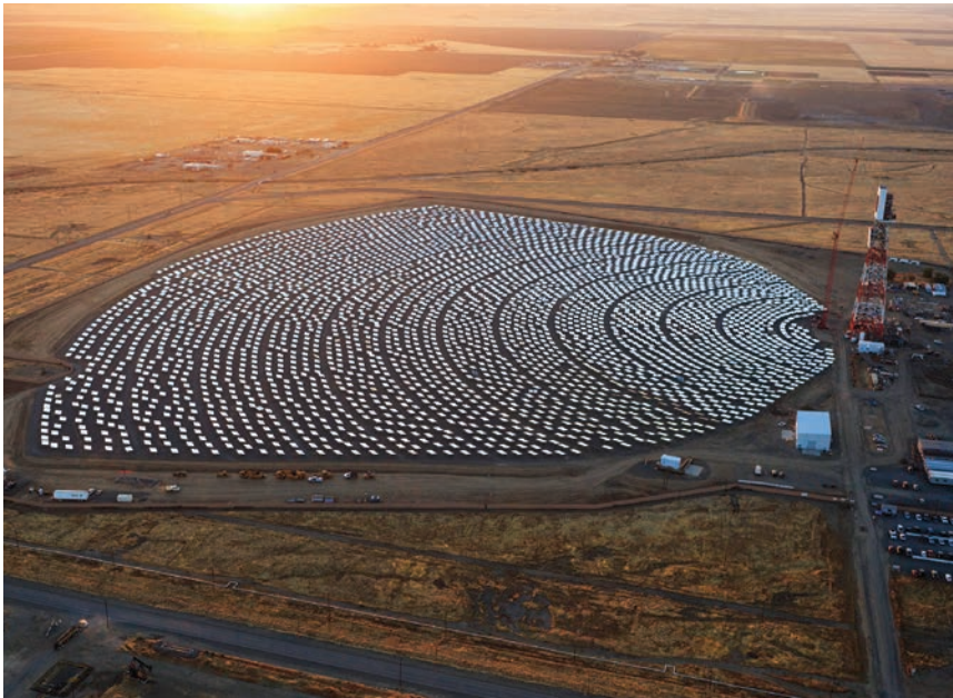
Jedno od tri polja elektrane Ivanpah

Elektrana Ivanpah proteže se na 1400 hektara i ostvaruje gotovo 30 posto solarne energije proizvedene u SAD-u