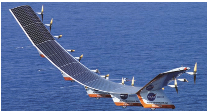
Izgled sadašnjih bespilotnih letjelica

Iako zamišljeno vrlo ambiciozno, posljednjih je godina bilo niz napredaka u oblikovanju i tehnologiji bespilotnih letjelica te istraživanja pokazuju da je koncept elektrane na nebu sasvim moguć. Primjerice, bespilotna letjelica tvrtke Solar može u zraku ostati do pet godina, a ona tvrtke Quadrotor može bežično puniti uređaje na zemlji. Povezivanje bespilotnih letjelica koje proizvode energiju u mrežu nudi i druge pogodnosti, među njima je međusobno povezivanje malih elektrana u zraku kako bi se pouzdano isporučile velike količine energije.