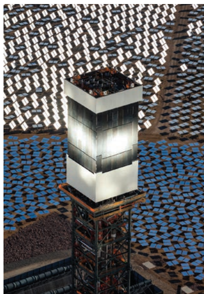
Refleksija Sunca s heliostata na toranj

Zelene tehnološke inovacije poput Ivanpaha stvaraju kritičnu masu za vodeću državu koja će na globalnoj razini vladati čistim energijskim tehnologijama nekoliko desetljeća. Osim što mijenjaju energetska pejzaž, velike su solarne elektrane korisne i za ekonomije pojedinih zemalja te načine proizvodnje i trošenja energije. Izgradnja elektrane Ivanpah nije dakako prošla bez prijepornih problema. Njezina golema veličina "pojela" je dio otvorenog zemljišta koji je bio središte izvorne flore i faune. Nadalje, postoje mnoga izvješća o smrtnosti ptica koje udaraju u ogledala ili su spržene dok lete iznad postrojenja. No kalifornijska je komisija za energiju u svom izvještaju navela da iako sunčana elektrana utječe na lokalnu sredinu, njezine prednosti znatno nadmašuju nedostatke. Možemo se pitati je li to još jedna pobjeda energijskog nad ekološkim lobijem i jesu li cijena energije i zarada na njoj jedino što je bitno u suvremenoj stvarnosti.