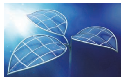
Sustavi ćelija za iskorištavanje Sunčeve energije