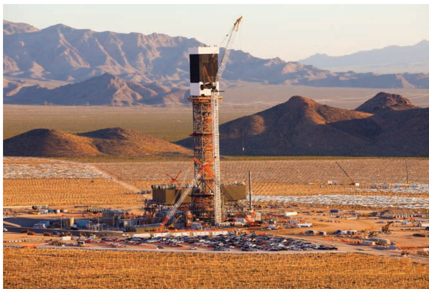
Gradnja solarnog tornja

ne energije proizvedene u SAD-u. Primjenjuje 173.500 heliostata (kompijutorski kontroliranih ogledala) koji prate sunčevu putanju i reflektiraju svjetlost na tri solar-na tornja s kotlovima punim vode. Kotlovi pregrijavaju vodu u super toplu paru na temperaturu do 550 °C koja zatim pokreće standardne turbine za stvaranje električne energije.